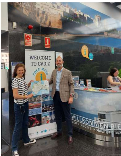
Planos facilitados por El Corte Inglés.